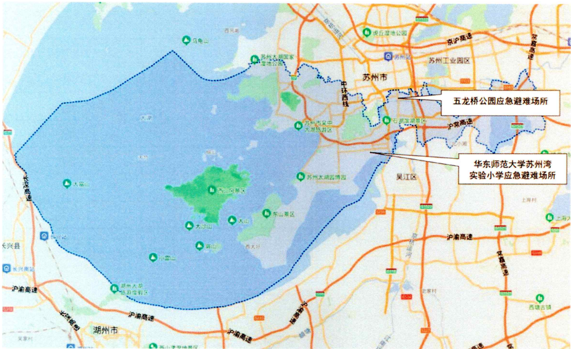
10.2-1 区应急避难场所分布图